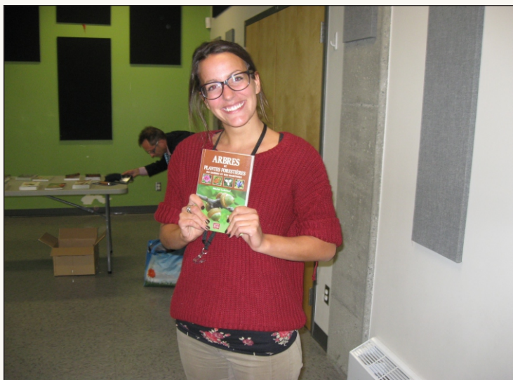
Gagnante d'un livre sur la nature (Éditions Michel Quintin) lors d'une conférence à PROP'EAU

Nous avons l'intention de continuer à présenter ces ateliers en 2019 et demander d'autre financement pour accomplir notre mission d'éducation et de sensibilisation.