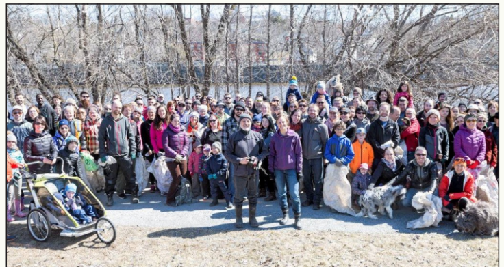
23 avril 2018 rivière Saint-François (Au Maxi)

Nous avons réalisé en tout 26 activités de nettoyage dont 5 à Windsor (rivière Watopéka), 2 au Cantons de Hatley (rivière Massawippi) et 19 à Sherbrooke. (Voir le tableau en page 2)