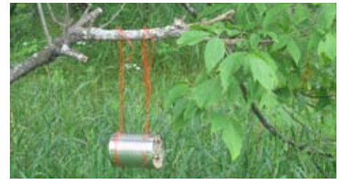
Nichoir d'abeilles sauvages installé au marais de la rivière aux Cerises à Magog le 13 juillet.