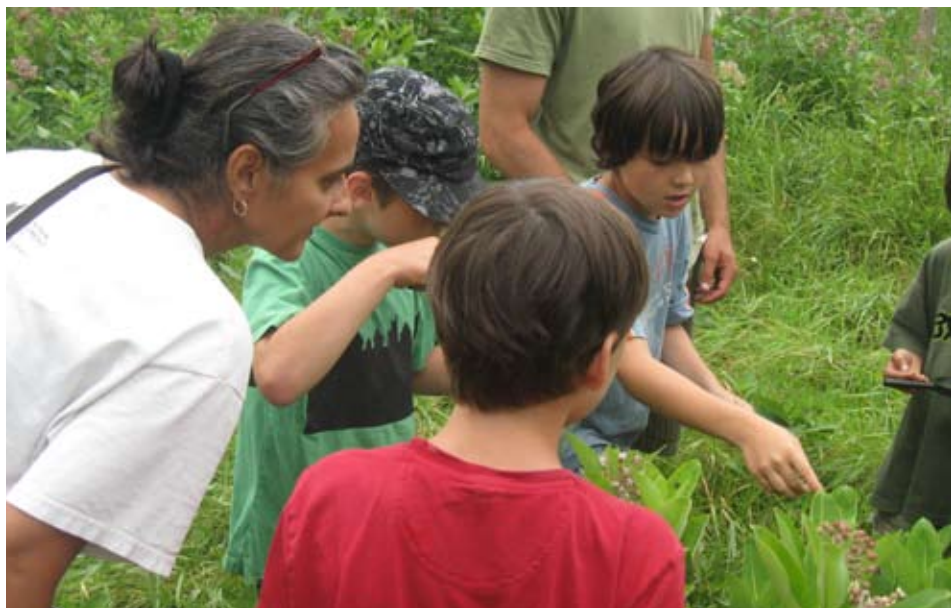
Observation de pollinisateurs sur des fleurs d'asclépiade avec les enfants du camp d'été du marais de la rivière aux Cerises à Magog le 13 juillet.

enfants de 7 à 13 ans durant l'été. Or, en juillet dernier, Action Saint-François a participé au camp d'été en réalisant un atelier sur les pollinisateurs pour les jeunes campeurs. Après avoir présenté les divers groupes de pollinisateurs au Québec, nous sommes allés à leur recherche dans les espaces plus