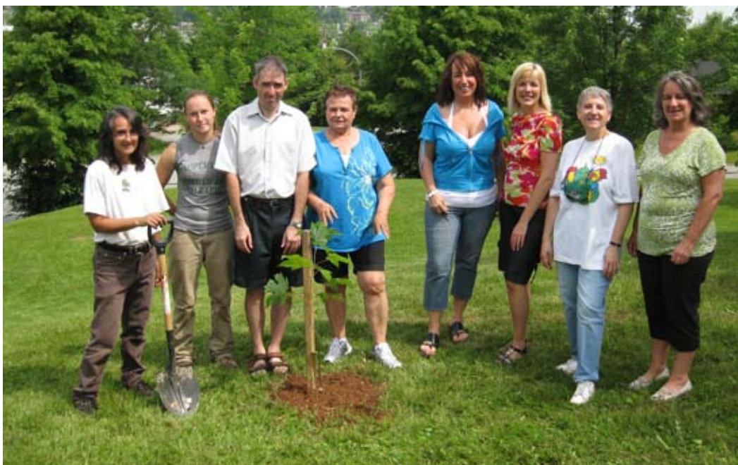
Plantation compensatoire avec le Centre d'entraide plus de Sherbrooke au parc Marie-Médatrice de Sherbrooke le 28 juin 2011.

À noter que le journal d'Action Saint-François n'est plus produit en version anglaise.