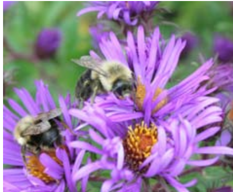
Bourdons sur des fleurs d'aster, Horticulture Indigo.

campus écodurables de l'Association québécoise pour la promotion de l'éducation relative à l'environnement (AQPERE). La