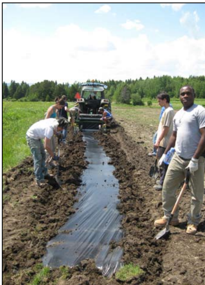
Déroutage du paillis de plastique à la ferme de Noël de Bruyère en juin avec une équipe de bénévoles.