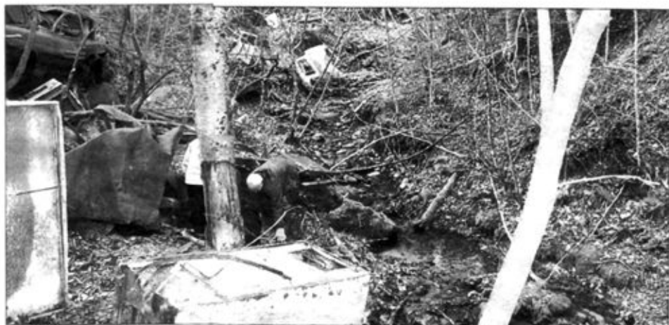
(COURTOISE ACTION SAINT-FRANÇOIS)

Chaque samedi matin, entre mai et la mi-novembre, les bénévoles se réunissent au stationnement La Grenouillère, au centre-ville de Sherbrooke, pour